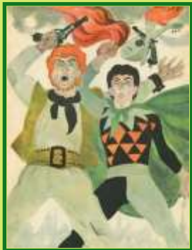
Ю. Олеша. Три толстяка