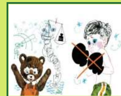
В. Драгунский «Денискины рассказы»