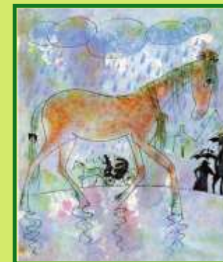
В. Левин «Глупая лошадь»