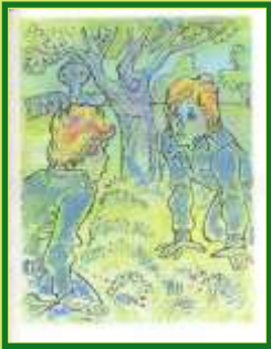
Велтистов Е.С. «Новые приключения Электроника»