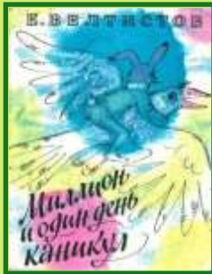
Е. Велтистов. Миллион и один день каникул